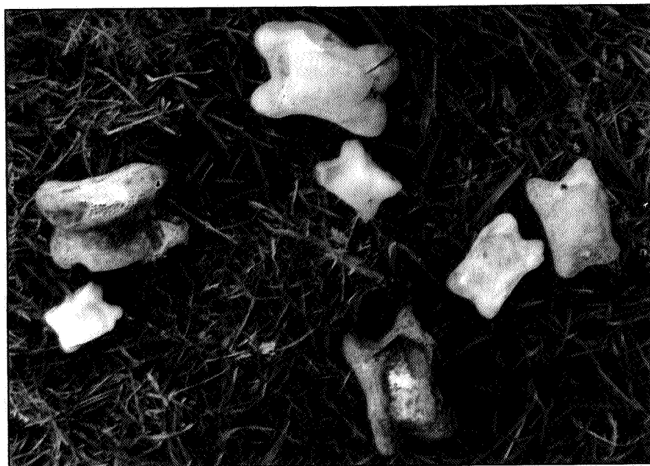
Benkyr – små knokler etter slakting – var mye brukt som leker i eldre tid, før plasten og kjøpelekene kom.